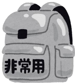
ぼうさい 防災リュック

ほか ひと なかみ ないよう じゅうじつ ○ 他の人からもアドバイスをもらい、中身の内容を充実させましょう。