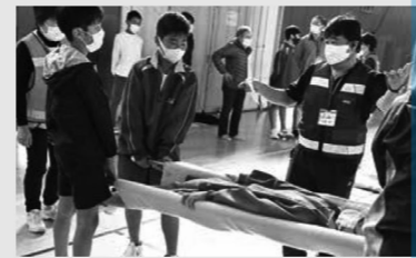
手作り担架で救助者を運ぶ訓練。「イチ・ニ」と、タイミングを合わせるのがポイントです。

旭中学の校長先生は生徒たちに「中学卒業後も訓練の経験を生かしてほしい」、そして「地域活動の担い手になってほしい」と期待しています。この訓練は、子どもから高齢者まで、世代を超えて協力できる力が養えるそうです。みなさんも、防災訓練に参加して、自分たちの大切な地域を守っていきましょう。