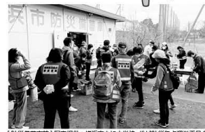
【防災備蓄庫】

地震のときに開設される避難所を「地域防災拠点」といいます。家屋の倒壊などにより、自宅にとどまれない人が一定期間避難生活を送る場所です。横浜市内で震度5以上の地震が発生したときに開設されます。地域防災拠点には、防災備蓄庫を設置し、自宅から持ち出せない人のための食糧や防災資機材を備蓄しています。横浜市内の市立小・中学校など459カ所が指定されています。 (令和7年4月1日現在)